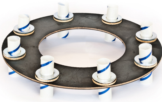
* Afbeeldingen en uitvoeringen kunnen afwijken